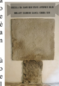
Imprimi baci sul sasso su cui stando il Santo un tempo rammollì col suo parlare i cuori induriti dalla colpa.

Il sacello antoniano è il luogo più interno, antico e conservato dell'intero Oratorio. Qui la tradizione vuole che abbia celebrato messa il Santo. La sistemazione attuale venne realizzata tra la fine del '600 e l'inizio del '700 quando il sacello era una Cappella interna alla sede confraternale. Il paliotto in marmo raffigura il Santo inginocchiato che adora il Bambino Gesù tenuto in braccio e mostratogli dalla Madonna. La scultura è attribuita alla scuola dei Bonazza. Più sopra, nella nicchia d'altare trova posto una statua lignea del Santo in atto di predicare. Alla sinistra dell'altare trovano collocazione due belle lunette dipinte nel '600 dal padovano Domenico Zanella. Quella più vicina all'altare raffigura il Miracolo del marito geloso mentre quella collocata sopra la finestra, che consente la visione del pozzo del miracolo, raffigura il Miracolo della predica ai pesci . Alla parete settentrionale dovrebbero trovare collocazione altre due lunette. La prima verso l'altare dipinta dallo Zanella e raffigurante il Miracolo della risuscitazione di un giovane a Lisbona e una seconda, opera più tarda di Francesco Mengardi, raffigurante il Miracolo della risuscitazione del piccolo Parvino . Le due lunette si trovano in attesa di restauro.