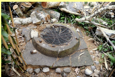
Pozzo del Miracolo del breviario

Le offerte raccolte andranno a coprire i costi sostenuti dall'Arciconfraternita per la realizzazione del progetto.