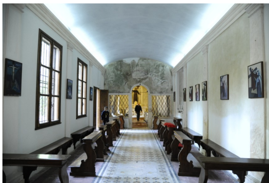
Interno dell'Oratorio, visione dal vestibolo d'ingresso verso la chiudenda del Sacello antoniano.

Eventuali altre aperture, anche serali, per gruppi che lo richiedessero potranno essere concordate con la segreteria organizzativa.