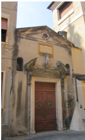
Facciata dell'Oratorio; si notino la statuetta del Santo sul timpano e il campani letto.