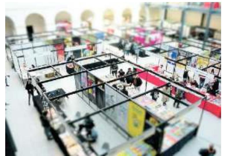
MOLTO INTERESSE Numeroso pubblico alle mostre del San Gaetano

Tutti gli eventi sono a ingresso libero, ma si consiglia la prenotazione: info@centrouniversitariopd.it; 049 8764688.