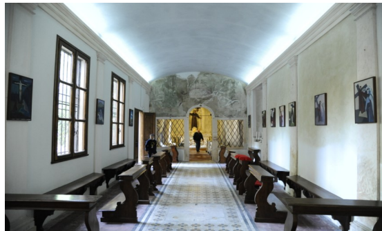
Interno, visione dal vestibolo d'ingresso verso la chiudenda del Sacello antoniano. In fondo a destra l'altare mariano.

La semplice facciata dell'Oratorio a un timpano è decorata con una statuetta del Santo in atto di predicare, realizzata in pietra tenera. Il luogo conserva una forte memoria storica antoniana non solo per il sacello dove tutto parla del Santo ma anche per le due reliquie di primaria importanza qui conservate: la pietra pulpito e il pozzo del miracolo del breviario .