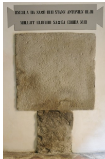
Imprimi baci sul sasso su cui stando il Santo un tempo rammollì col suo parlare i cuori induriti dalla colpa.

Alla parete settentrionale dovrebbero trovare collocazione altre due lunette raffiguranti il Miracolo della risuscitazione di un giovane a Lisbona , opera più tarda di Francesco Mengardi e il Miracolo della risuscitazione del piccolo Parrasio opera dello Zanella. Le due lunette si trovano in attesa di restauro e di benefattori.